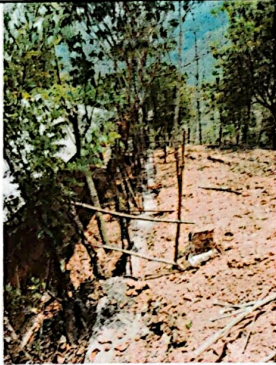
Foto 1: Se puede observar la fundición de la base que sostendrá el muro perimetral