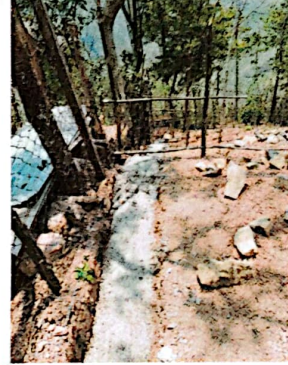
Foto 2: Se puede la fundición de la base que sostendrá el muro perimetral desde otro ángulo.