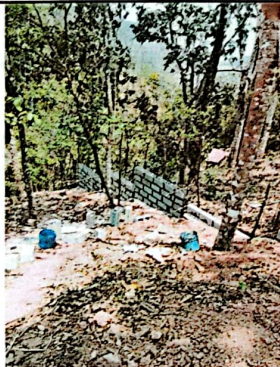
Foto 3: Se puede observar la fundición del muro perimetral en la parte de abajo la escuela.