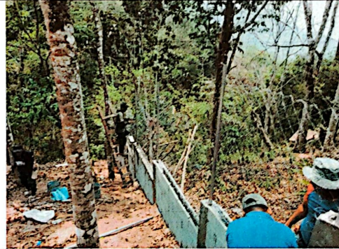
Foto 6: Se puede observar la instalación de la malla al muro perimetral.

Observación: Si es necesario se pueden agregar hojas adicionales y actualizar el número de hojas.